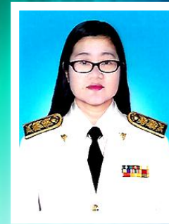
นางงามพันธุ์ ชิตมินทร์ นักกายภาพบำบัดชำนาญการ ปี ๒๕๖๑